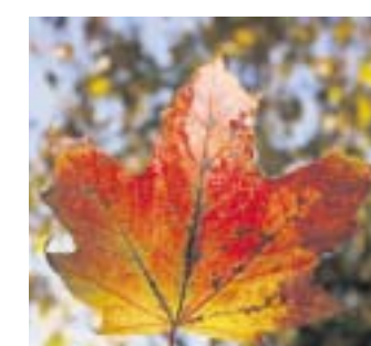
Der Ahorn und die ahornblättrige Platane sehen einander zum Verwechseln ähnlich.