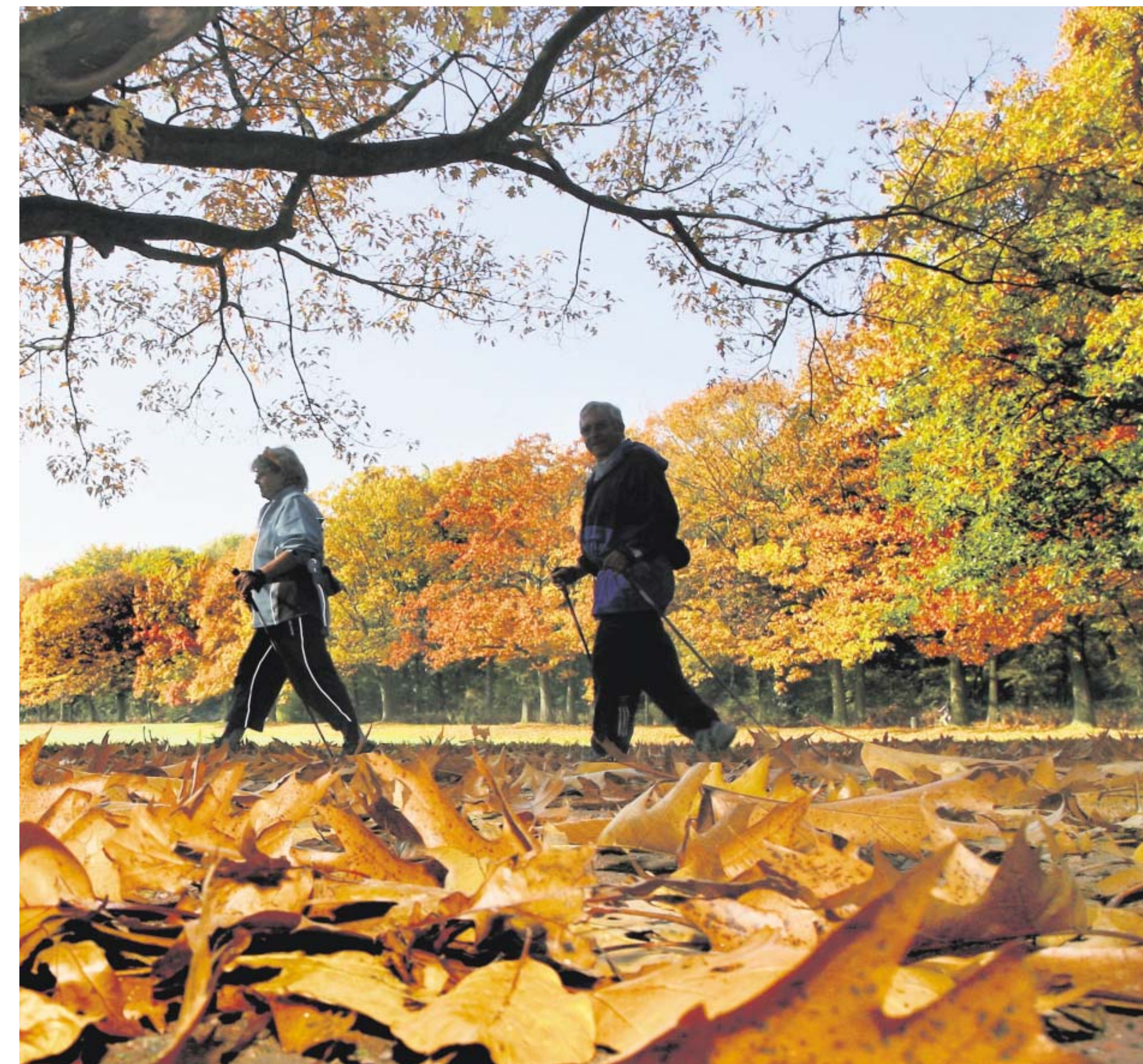
Gehen, um sich fit zu halten: Das ganz normale Spazierengehen wird heute immer seltener als Tätigkeit empfunden, denn viele Menschen orientieren sich nur nach dem Zweck, etwa hier beim herbstlichen Nordic Walking.

Eine Brücke, eine Treppe, ein Pfad. Hier wird das Pflaster holprig. Pappeln biegen sich zum Tor. Wie alles anders aussieht nach einer kleinen Wendung! Bahnhinterland. Auto- bahnhinterland. Vergessenes Land. Auf den Zweigen sitzen Brombeeren, es regnet Laub. Ich denke, dass wohl selten jemand diesen Abstieg findet. Weisshaar: Spazierengehen ist Wahrnehmen. Dinge sehen, die man sonst übersieht. Die man vom Auto aus nicht be-