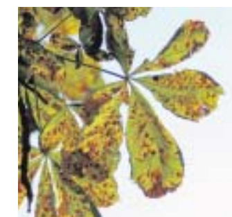
Die Rosskastanie: Die gefiederte Fingerform ist typisch für ihre Blätter.