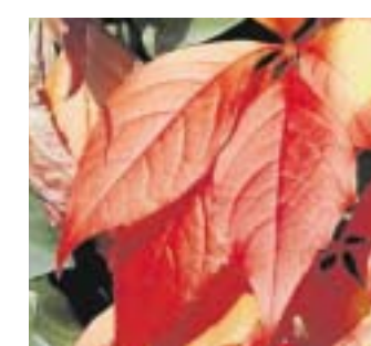
Das Weinlaub färbt sich im Herbst wunderbar rot und rankt herab.