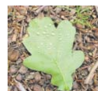
Eichenlaub hat typische Ausbuchtungen, die man aber auch bei der Linde findet.